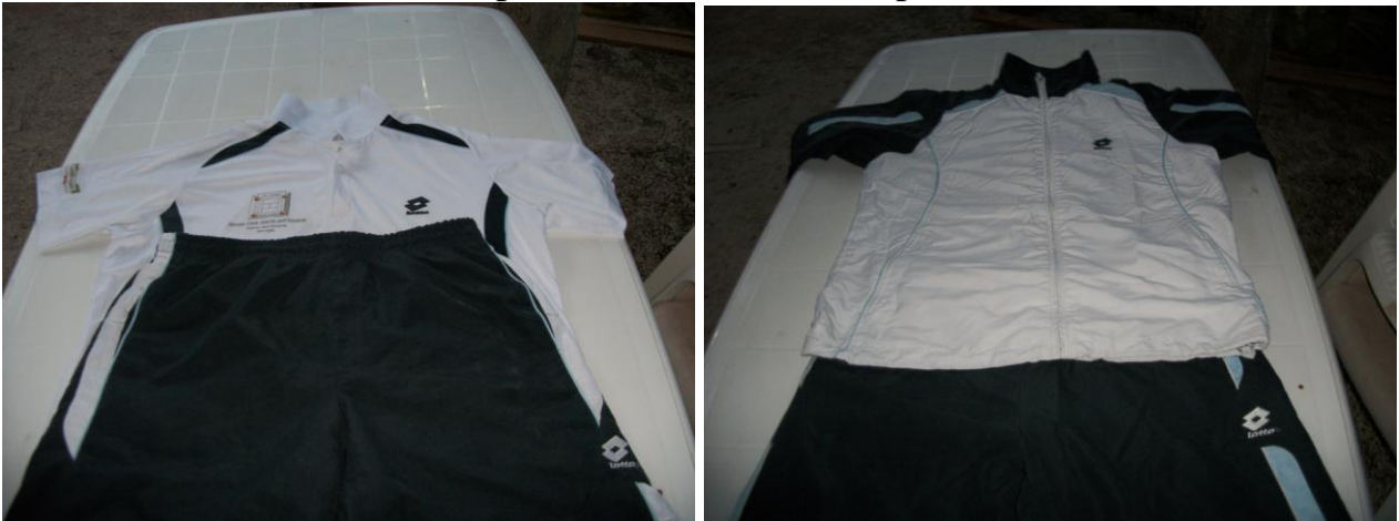
Divisa + felpa del 2010 (Sponsor Farchioni Olii S.p.a.)